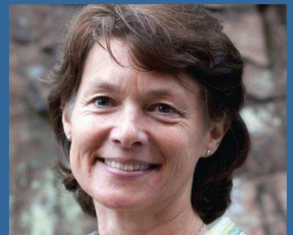
Læge og hjerneforsker, Center for Sund Aldring, Københavns Universitet